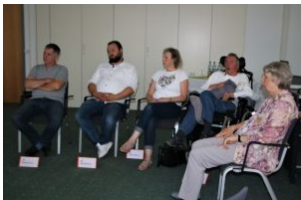
Workshop Ängste

Im Workshop „ Tagesstruktur und wenn die Angebote vor Ort fehlen? “ wurde das fehlende Tagesangebot für Menschen mit einer Hirnverletzung, also eine geregelte Tagesstruktur und einen strukturierten Tagesablauf auch außerhalb der eigenen Häuslichkeit zu ermöglichen, thematisiert. Dabei diente die gemeinnützige Einrichtung für erwachsene Schädelverletzte in Heidelberg, der Treffpunkt SHV e.V., als Ideengeber.