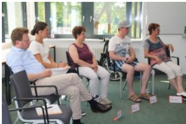
Workshop - Bild: SHV - FORUM GEHIRN e.V.

Jeder Workshop-Leiter führte die Teilnehmer mit einem Beispiel aus der Praxis in das jeweilige Thema ein. Danach wurde in den durchgeführten Workshops das entsprechende Thema ausführlich erörtert um mögliche Lösungsansätze zu finden.