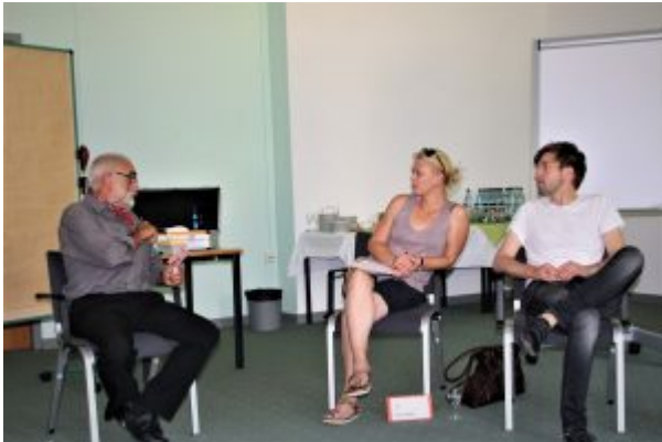
Workshop Selbsthilfe

geleistete Pflege- und Betreuungsarbeit und das Verständnis für die veränderte Lebens- und Familiensituation nach dem traumatischen Ereignis, welches zu der Hirnverletzung geführt hat. Dieses Verständnis gibt es unter den Gleichbetroffenen aber leider nicht im normalen sozialen Umfeld.